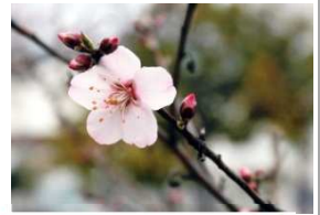
アシテムのアーモンド 平成30年3月撮影