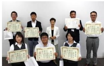
アシシステム経営計画会にて永年勤続表彰